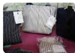
葛塚縞を使ったバッグ

葛塚縞は、旧豊栄市の地名を冠した綿織物です。太い綿糸を使用することと、昔のままの技法による藍染に特徴があり、丈夫でかつ、藍による虫よけ効果で、野良着として需要がありました。